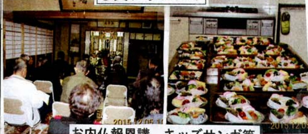
お内仏報恩講、キッズサンガ等